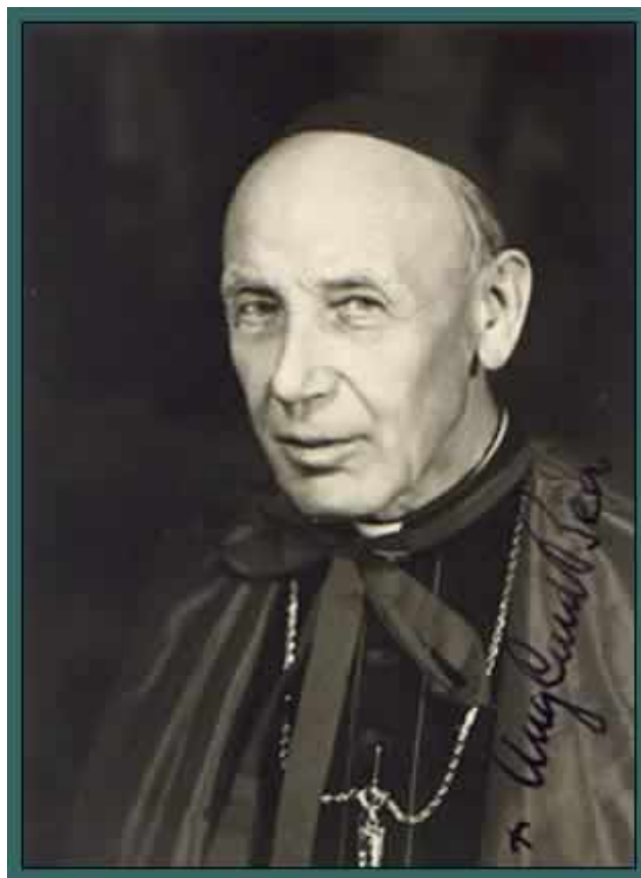
Cardenal Agustín Bea, S.I.

Corría febrero de 1965, plena etapa conciliar aún, cuando el cardenal Bea giró visita oficial como presidente del Secretariado romano de la unidad a la sede del CEI en Ginebra. Fue el 18 de febrero de 1965 1 y registró dos momentos importantes: uno, el de la calurosa acogida que los anfitriones dispensaron al huésped de la Santa Sede; otro, el del «coloquio» público entre el Cardenal y el pastor Marc Boegner, uno de los seis primeros copresidentes del alto organismo en 1948, pastor y ecumenista de fama universal 2 . De todo ello quiero yo escribir en estas páginas, haciéndolo precisamente como evocación y modesto homenaje a la egregia figura del hombre de Iglesia en el XL aniversario de su muerte.