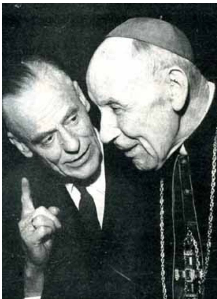
El cardenal Bea y Willem Adolf Visser't Hooft, primer Secretario General del CEI

el prestigio de Osio?, ¿en Calcedonia el de León? ¡En el Vaticano II fue incontestablemente Juan XXIII el que desempeñó este papel, lo mismo ausente que presente! También el cardenal Bea gozaba de notable estima. Había sido confesor de Pío XII, director del Pontificio Instituto Bíblico (sus intervenciones contenían observaciones críticas sobre el uso de los textos escriturísticos en textos a debate). Presidía el Secretariado para la unidad, que Juan XXIII había elevado al rango de Comisión, con derecho a presentar esquemas en nombre propio. Ideas y términos fueron a menudo preferidos o rechazados en el Vaticano II según pudiesen favorecer o ser contrarios al ecumenismo. Se escuchaba al cardenal Bea. Con Máximos IV y otros de los que se me consentirá no suministrar un elenco que no podría sino ser subjetivo, incompleto y discutible, fue una de las grandes figuras del Concilio» 60 .