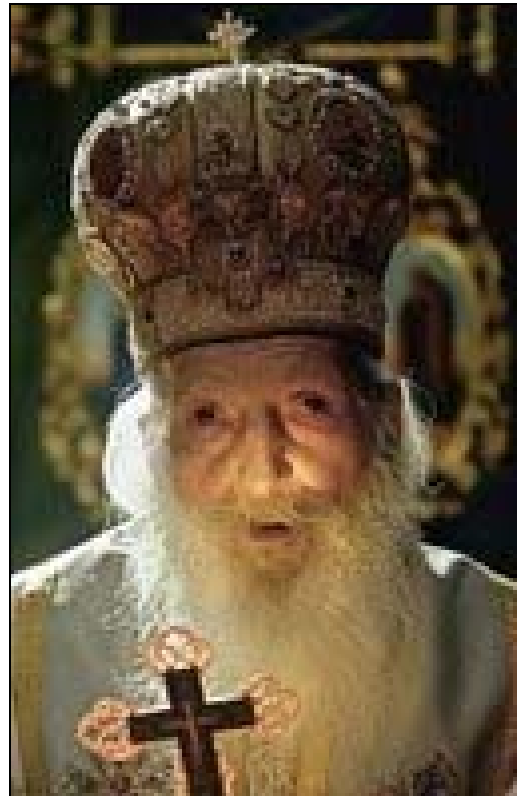
Su Santidad Pavle, patriarca de la Iglesia ortodoxa de Serbia (11-IX-1914 + 15-XI-2009)