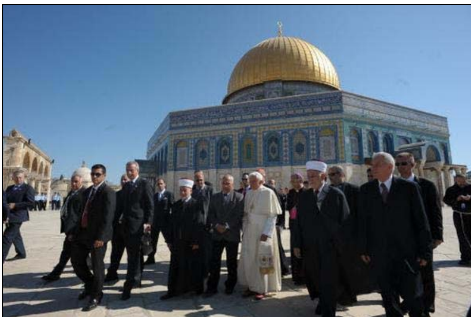
Jerusalén: Benedicto XVI en la explanada de las Mezquitas (12-V-2009).

Martes, 29 dic (RV). - Prosigue hoy nuestro colaborador el P. Pedro Langa Aguilar evaluando lo que el II trimestre de 2009 dio de sí en el plano ecuménico.