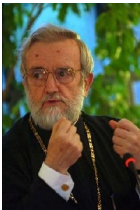
El metropolitano Ioannis Zizioulas, Copresidente ortodoxo de la Comisión Mixta Internacional en Pafos (Chipre)

🔊 (PL)- «Del 16 al 23 de octubre en Pafos, Chipre, la Comisión Mixta Internacional para el diálogo teológico entre la Iglesia católica y la Iglesia ortodoxa en su conjunto durante su XI reunión centrada en «El papel del obispo de Roma en la comunión de la Iglesia en el primer milenio». «Discuten los ortodoxos sobre las reacciones negativas al diálogo por parte de algunos grupos suyos, extremo unánimemente considerado del todo injustificable e inaceptable, pues presentan información falsa y que crea confusión». Kasper concede que «los pasos son pequeños y lentos» porque el argumento de la discusión es grave, complejo y muy emotivo desde hace siglos. Y el otro co-presidente, metropolitano ortodoxo Zizioulas, que «el primado es problema eclesiológico», y como la eclesiología forma parte de la dogmática, es «cuestión de fe». Se anuncia, en fin, la XII sesión para el 20-27 de septiembre de 2010 en Viena, con el cardenal Schönborn de anfitrión.