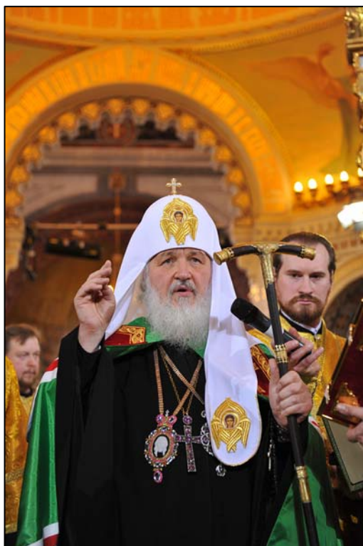
Entronización de Su Santidad Kirill, Patriarca de Moscú y de todas las Rusias (1-II-2009)

Lunes, 28 dic (RV). - En esta primera entrega se propone afrontar los hechos más salientes del primer trimestre de 2009.