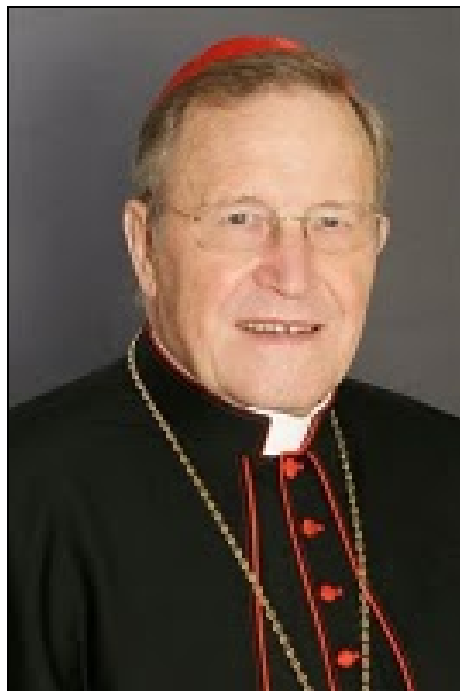
El cardenal Walter Kasper, Copresidente católico de la Comisión Mixta Internacional en Pafos (Chipre)